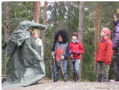
St Georg og dragen. Bildet er tatt da flokken øvde på skuespillet som ble fremført under leirbålet på Øvredammen den 17. april.