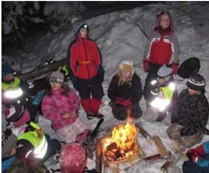
Peffene har laget et flott bål med kun én fyrstikk!

Tirsdag 26. januar hadde vi patruljekonkurranse, og en av oppgavene var at alle peffene skulle samarbeide om å lage et bål. Det viste seg at det skulle bli det flotteste bålet flokken har laget hittil, og de fikk fyr på første forsøk. Kun én eneste fyrstikk ble brukt denne kvelden! Det var stor innsats og utmerket samarbeid. Ingen tvil om at det ble poeng til alle patruljene på den oppgaven.