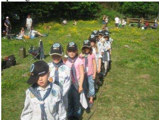
Flokken klar til avmarsj søndagens rundløype

Lørdag kveld var det felles leirbål med underholdning og speiderne viste frem alle de tingene de hadde laget i løpet av dagen: Det var memoryspill, tennisracketter, søppelstativ og "søppelmaskot (maskot laget kun av søppel). Alt ble laget av enten søppel eller ting vi fant i naturen og barna utviste stor kreativitet. Noen av lederne måtte også konkurrere, og Tor ble ny regjerende mester i lakris-snorspising.