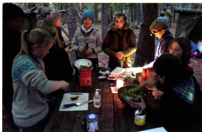
Forberedelser til matkonkurranse.