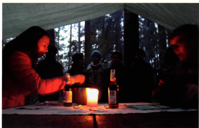
Dommerne i matkonkurransen fikk flotte rammer da de skulle dømme.

Det offisielle programmet lørdag ble avsluttet med et flott leirbål ledet av roverne. Etter leirbål ble de fleste ved bålet, men de ivrigste JOTA-speiderne fikk kjørt noen flere kontakter på radio.