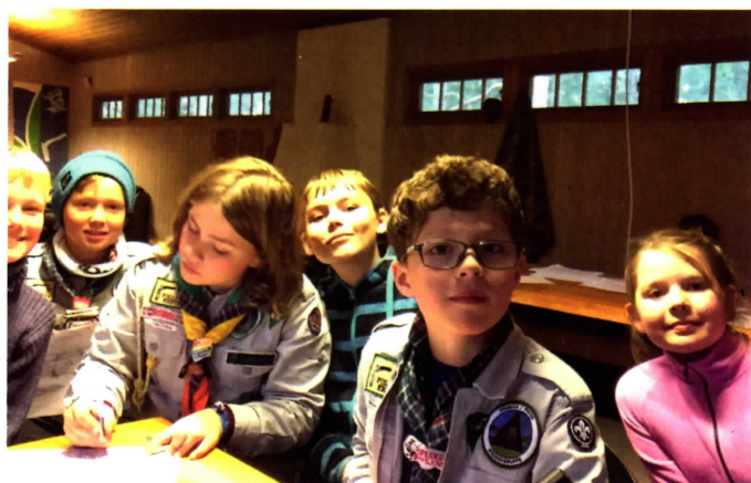
Speidere ved 80 meter-stasjonen.