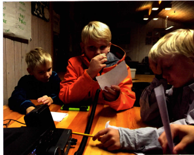
Småspeidere sender hilsen til speidere i Vestby.

Selv om meteorologene forsøkte å sabotere det de kunne, holdt det seg tørt til leirbålet var ferdig. Nok en gang ble det en vellykket JOTA/JOTI, med rekordstor deltakelse. BRUF (førerpatruljen), ledere og rovere tyvstartet og møtte på Speiderhytta allerede fredag kveld. Roverne ordnet taco til alle mens BRUF gjorde BRUFting og radioamatørene rigget opp radioer.