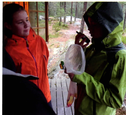
Instruksjon i Legobygging via PMR.